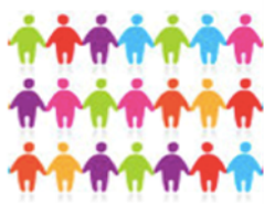
20 mulheres com celulite graus II e III